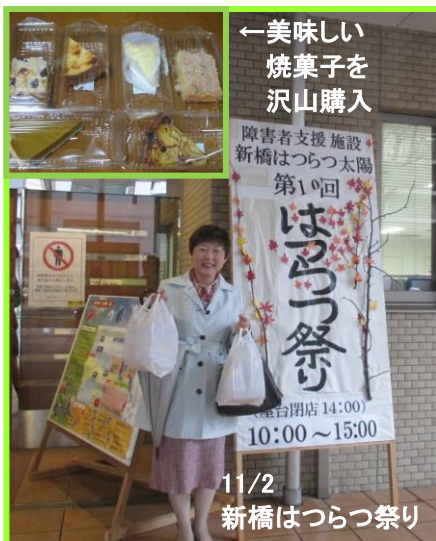
←美味しい焼菓子を沢山購入 新橋はつらつ太陽 障害者支援施設 第1回 はつらつ祭り