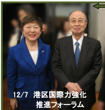
12/7 港区国際力強化 推進フォーラム