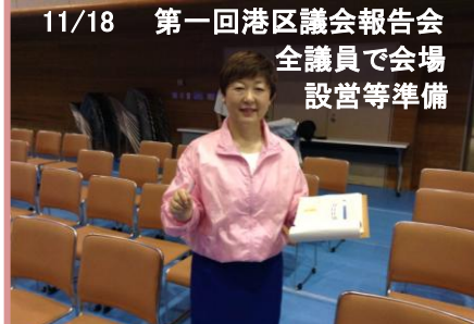
11/18 第一回港区議会報告会 全議員で会場 設営等準備

障害者週間記念事業～ともに生きるみんなの集い～ 高田裕士・千明夫妻による記念講演に大感動！ 裕士さんは 最重度聴覚障がい者 でデフリンピック 陸上競技 400m ハードル日本記録保持者！ 千明さんは 全盲 でパラリンピック陸上競技走幅跳 と短距離走のトップアスリート！ メダル裏は点字 →