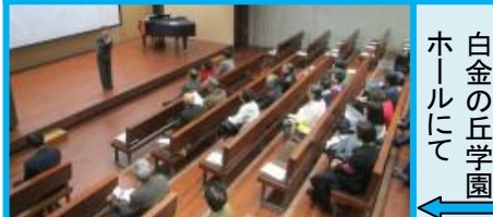
白金の丘学園 ホールにて